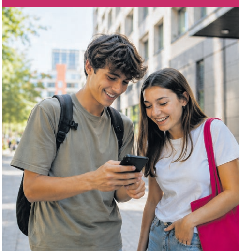
Mobile-Abo zum Spezialpreis

Mit dem BSU-Young-Konto profitieren junge Kundinnen und Kunden jetzt von einem exklusiven Mobile-Vorteil: Dank der Partnerschaft zwischen der Bank BSU und der GGA Maur kostet das BSU-Young-Mobile-Angebot der GGA Maur nur 5.90 Franken pro Monat statt regulär 9.90 Franken.