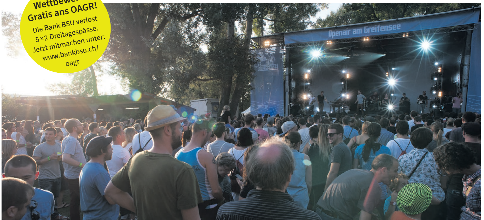
Die einzigartige Stimmung am Openair

Die Bank BSU verlost 5 x 2 Dreitagespässe. Jetzt mitmachen unter: www.bankbsu.ch/ oagr